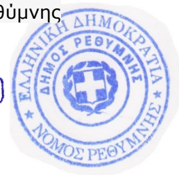
ΓΙΩΡΓΗΣ Χ. ΜΑΡΙΝΑΚΗΣ

ΣΥΝΗΜΜΕΝΑ : Το σχέδιο Διακήρυξης με τα Παραρτήματά της.