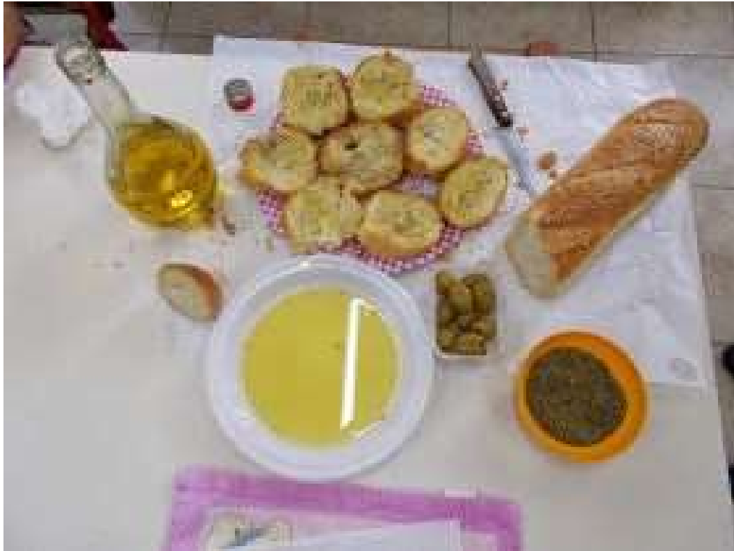
Βιωματική προσέγγιση (Βάζουμε τα παιδάκια να δοκιμάσουν το ψωμάκι με το λαδάκι).