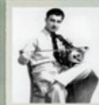
Ανδρέας Φοτίνος (1915-2002)