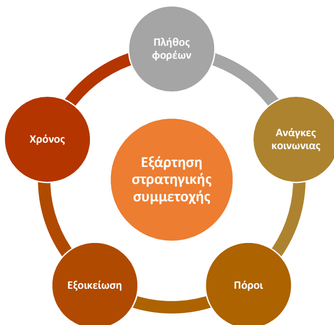
Εικόνα 2.2: Κρίσιμες παράμετροι καθορισμού στρατηγικής συμμετοχής

Λαμβάνοντας υπόψη τη μεταβλητότητα των αναγκών σε μια στρατηγική συμμετοχικού σχεδιασμού, η υιοθέτηση μιας στρατηγικής από κάποιο άλλο ΣΒΑΚ, ως καλή πρακτική, κρίνεται ως μη σκόπιμη. Αντιθέτως, εφαρμόζοντας τις μεθόδους του συμμετοχικού σχεδιασμού, η στρατηγική θα πρέπει να προκύψει ως αποτέλεσμα μελέτης της ομάδας έργου του ΣΒΑΚ, που θα προσαρμόζεται στις ανάγκες και τα χαρακτηριστικά του Δήμου.